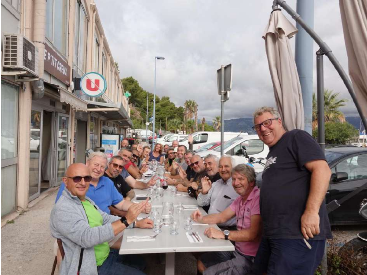
Echanges avec les auditeurs ISO