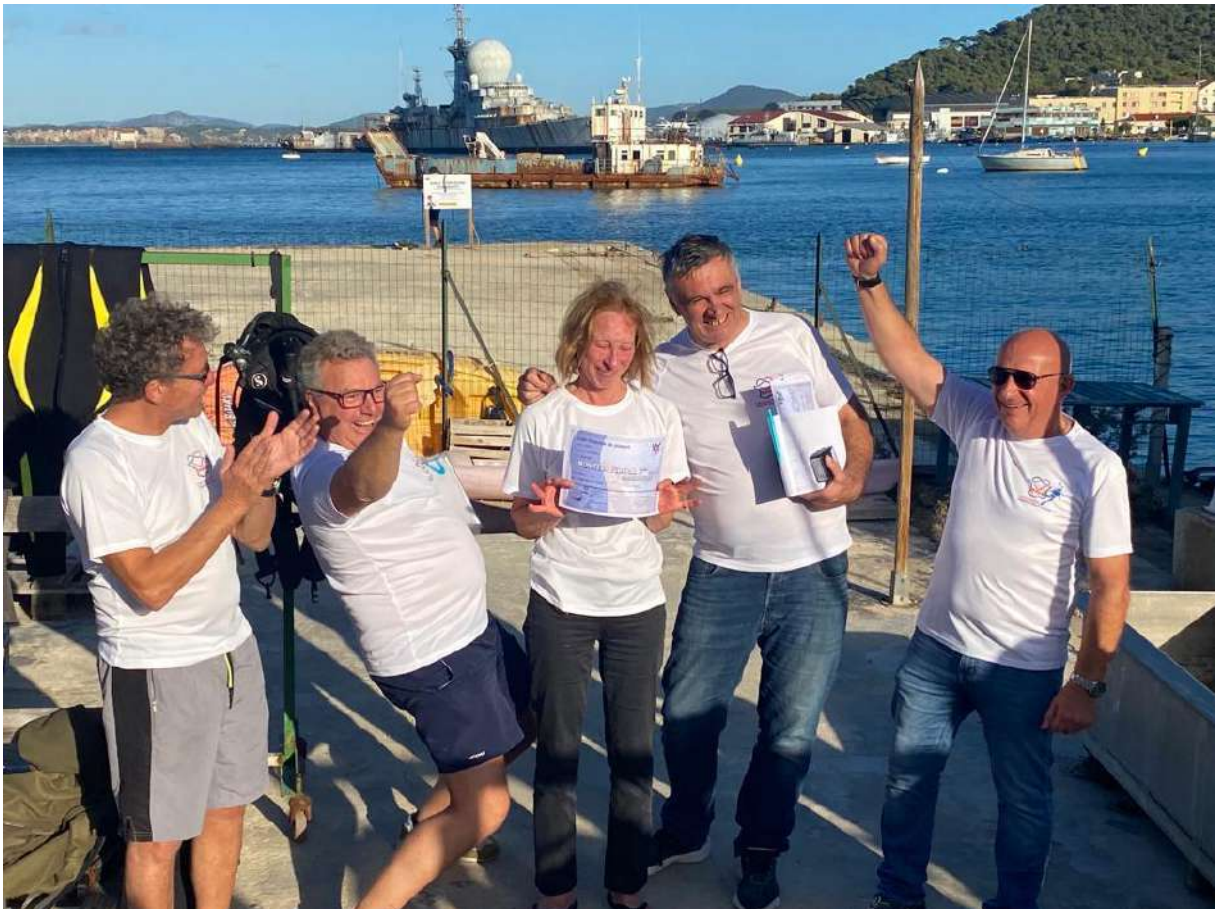
Un moment inoubliable : la réception de son brevet MF2