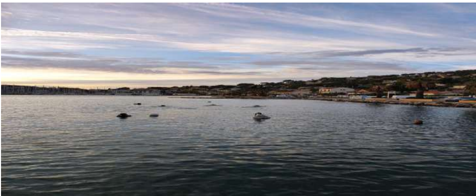
Atelier mannequin GP