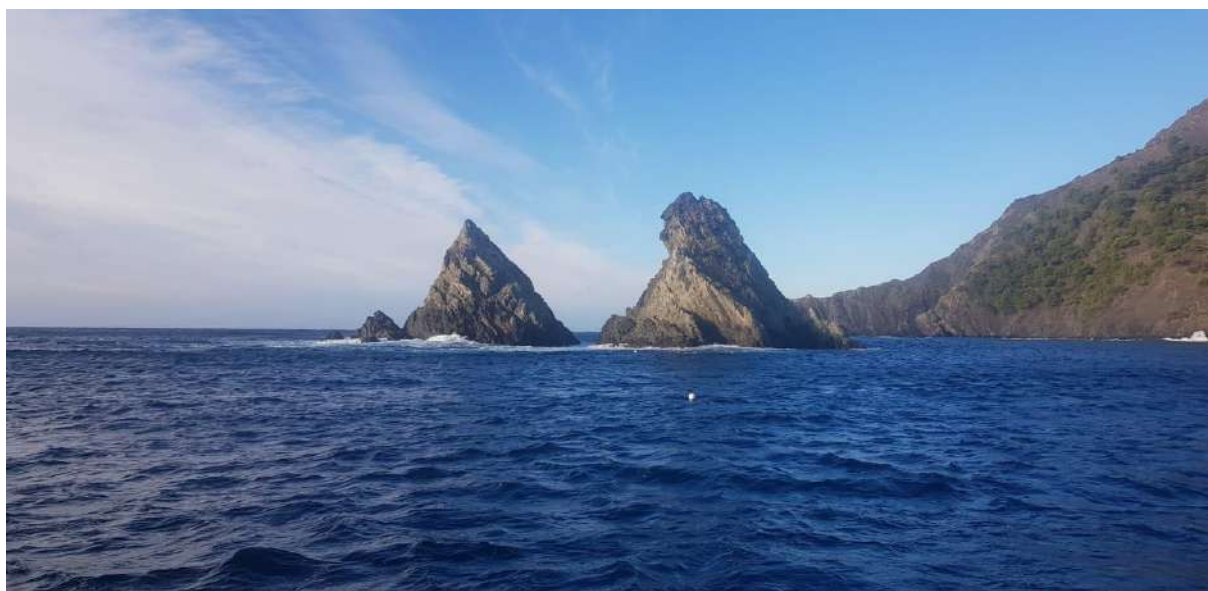
Les deux frères

Le mercredi 25 octobre 2023 , après le petit déjeuner RDV au centre de plongée pour :