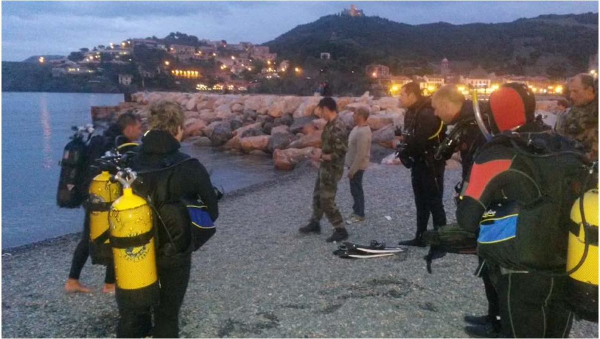
Présentation du site avant la plongée de nuit