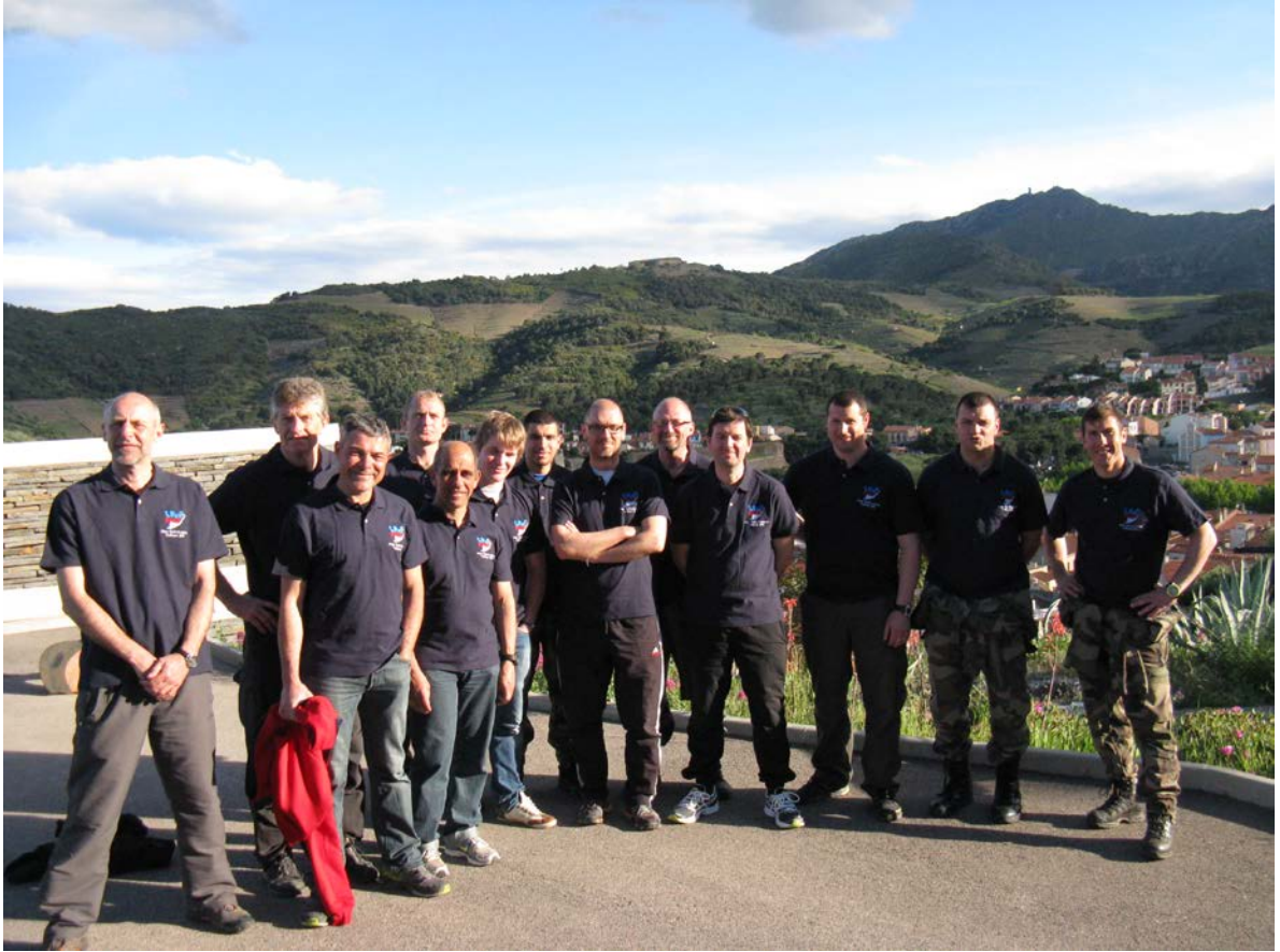
Photo de groupe au fort Miradou