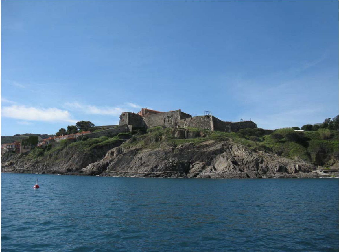
Fort Miradou / Site de plongée sur 20m