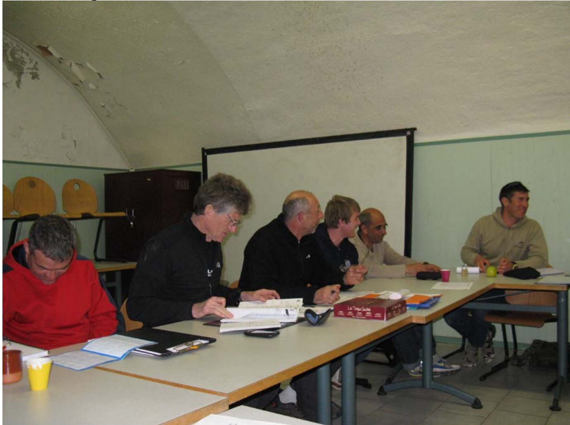
Bonne humeur et travail