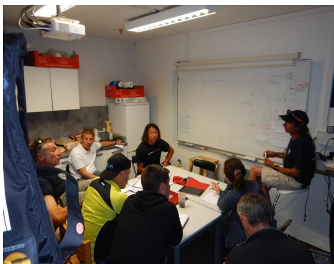
Intervention du Maître vénéré !