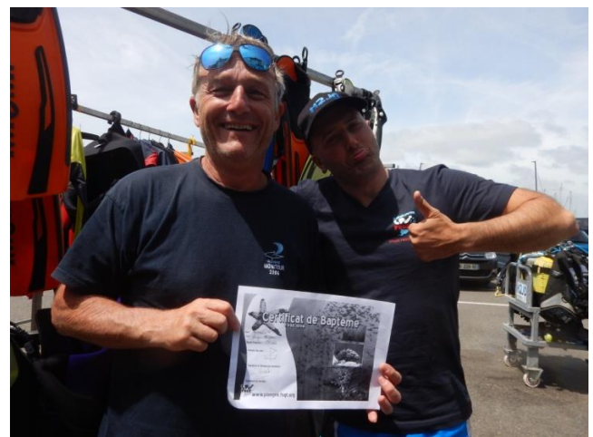
Sans oublier celui du représentant fédéral

... Et pour célébrer joyeusement tous ces succès, un traditionnel banquet à été dressé au cœur du village du Crouestix et comme à l'accoutumée, tous les irrésistibles Squabagaulois et Squabagauloises y étaient à l'honneur !