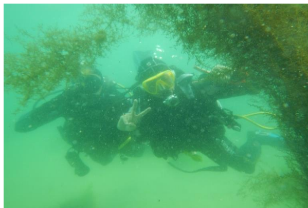
Conduite Baptême Mf (Amélioration de la visi ☺)