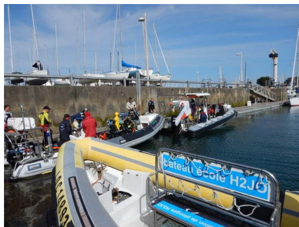
Y'a-t-il un pilote sur le bateau ?