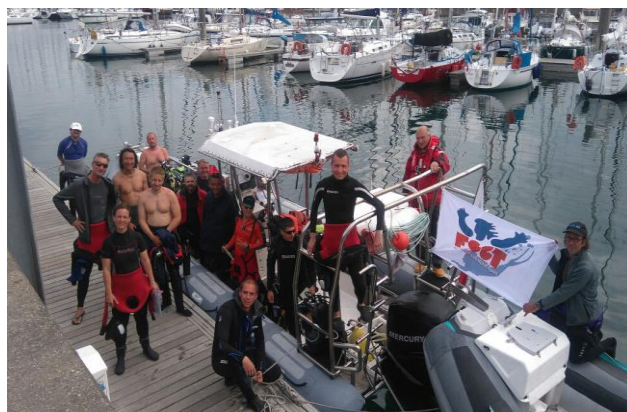
L'Amiral surveille sa flotte !