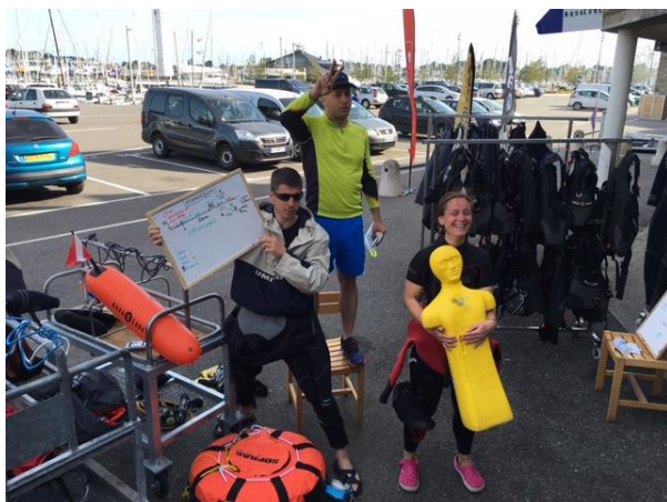
Briefing épreuve mannequin