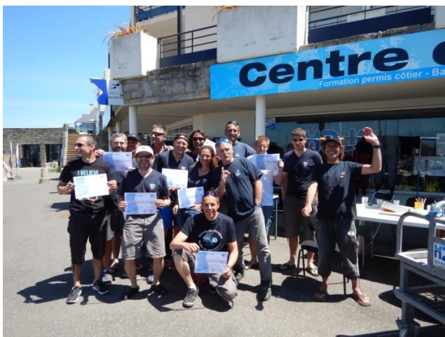
Remise des diplômes aux heureux lauréats !

Re-saluons également les efforts du chef de centre à fédérer autant que faire ce peut , les centres de la région et contribué ainsi à la richesse des échanges tant avec les cadres qu'avec les stagiaires.