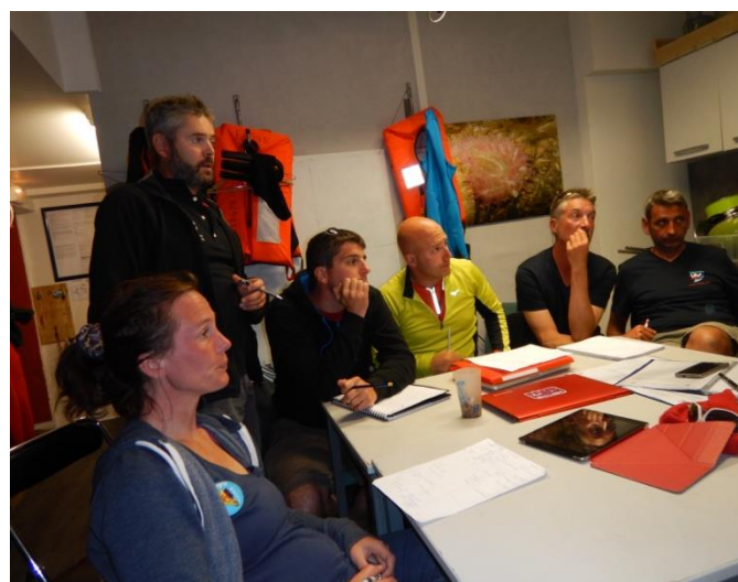
Concertation et concentration de Mf2 et Mf1 en devenir !