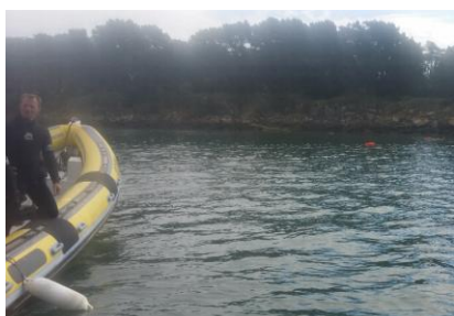
Mannequin et Apnée