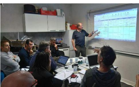
La salle de cours