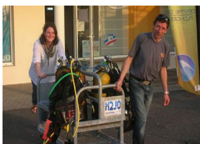
Les chariots de portage