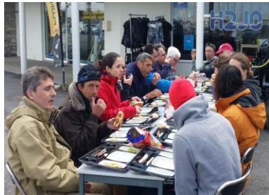
Pause repas !!!