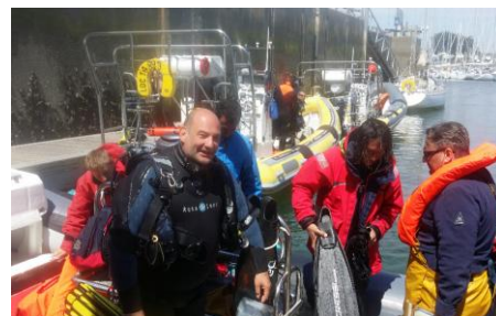
Arrivée au bercail