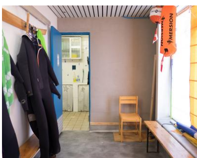
Vestiaires coté femme