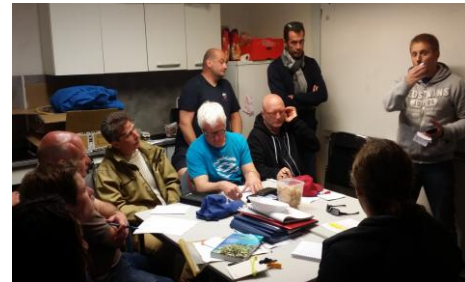
Brainstorming (RRoonnzzz ... !)