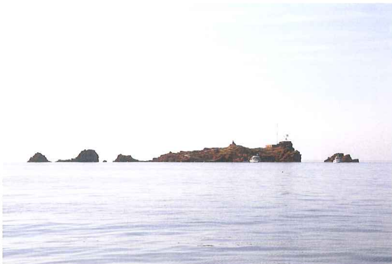
LE LION DE MER

Les sites de plongées sont à la fois agréables et multi niveaux (profondeurs de 5 à 50m) et ne nécessitent pas beaucoup de navigation.