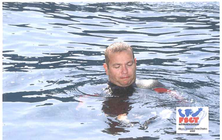
Le représentant fédéral - Stéphane COFFIN