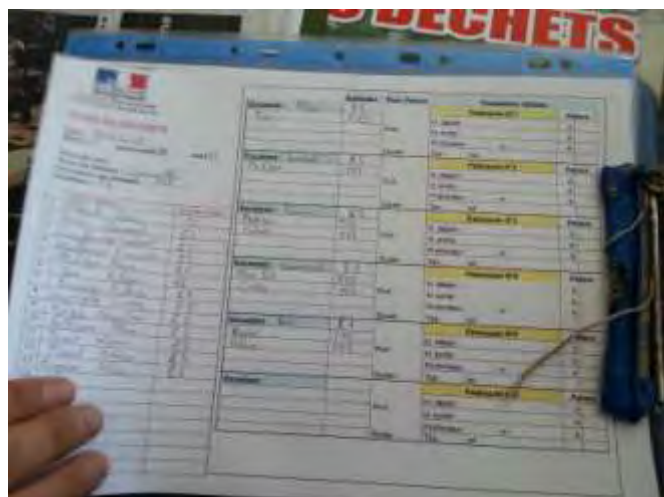
La fiche de sécurité

Mais dans tous les cas ça se passe mieux avec le sourire !