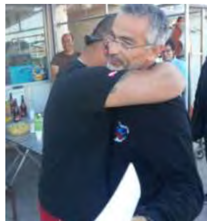
Quoique ... tout compte fait...