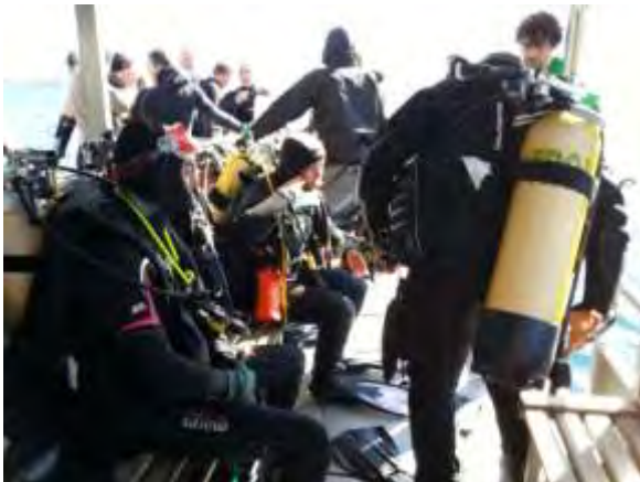
Branle bas de combat !