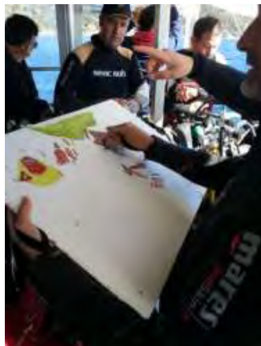
Et donc planification de la plongée