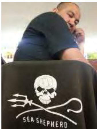
Il y a quand même des "durs" dans le monde de la plongée !