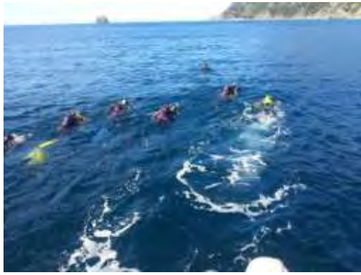
Le capelé (facile : départ à fond, puis on accélère!)