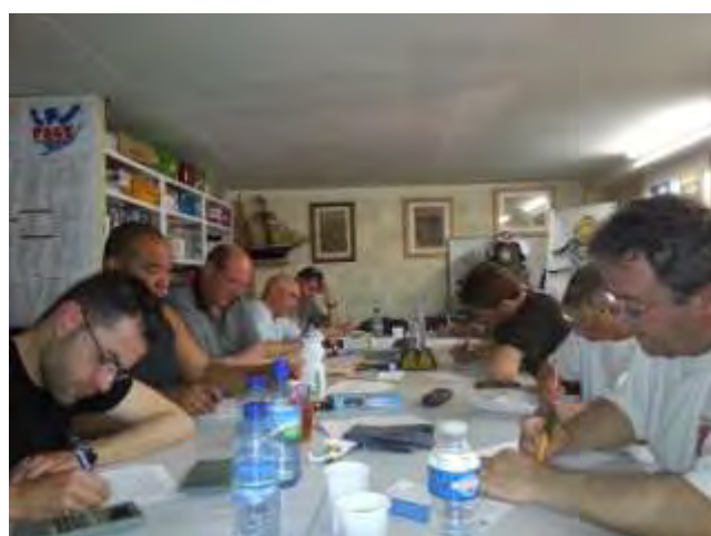
... voire même très studieux