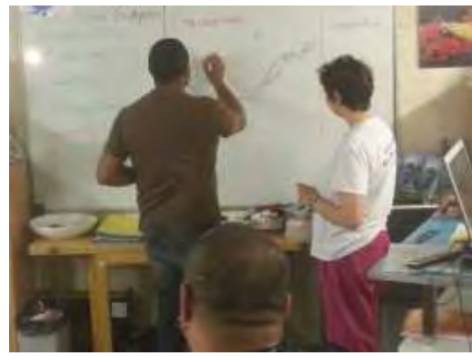
LE cours théorique