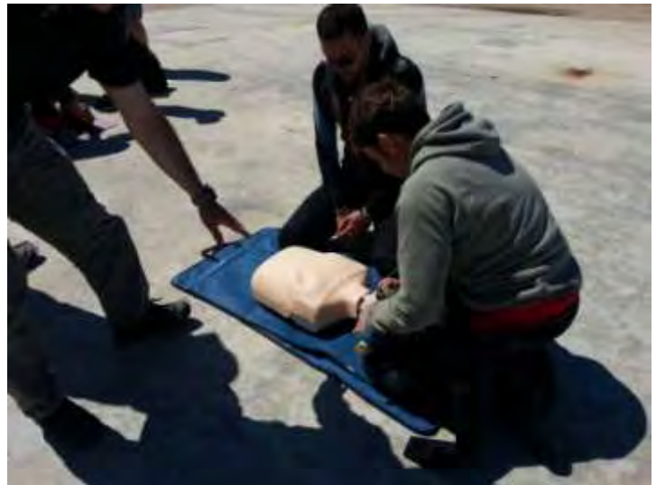
..... et ateliers spécifiques de prise en charge sur le quai