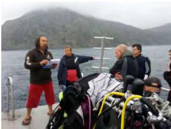
DS et DP : pas forcément facile tous les jours !