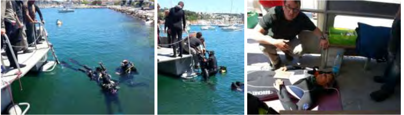
Travaux pratiques sur le bateau.....

Organisée et gérée par les E4 et E3, elle a été faite au port, de façon à en faciliter l'utilisation du mannequin de démonstration et du défibrillateur. Les tests de remontée d'un accidenté à bord par prise d'échelle a pu être mis en place, à partir d'un signe de détresse, puis d'un tractage et du déséquipement, avec la participation active des stagiaires GP en formation.