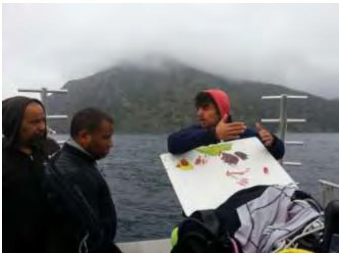
Présentation du site

A l'époque de la plongée moderne (?) à l'ordi, ne négligeons pas cet enseignement dans nos formations : la planification qu'elle que soit sa forme reste un des meilleurs éléments de sécurité.