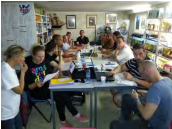
Cogito ergo sum (?)