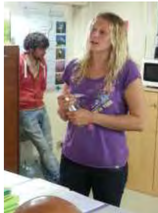
A blond with a brain !