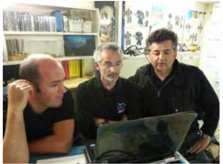
Le(s) coin(s) des jurys. Studieux aussi.