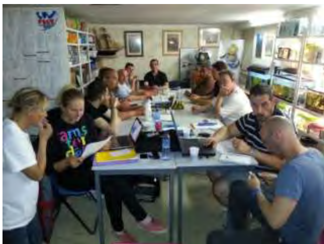
Studieux les stagiaires.....

Bon ....mais ça fait un peu laboratoire du docteur Jekyll tout ça !