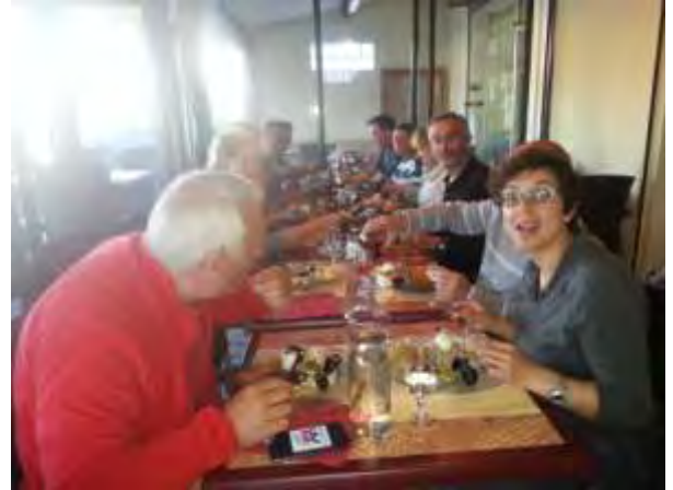
L'ailloli de fin de stage au Bellevue !