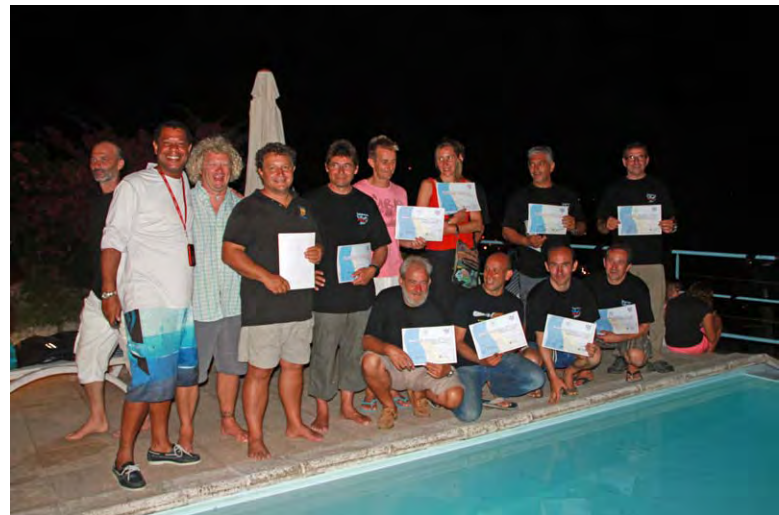
Une partie des lauréats et du jury...