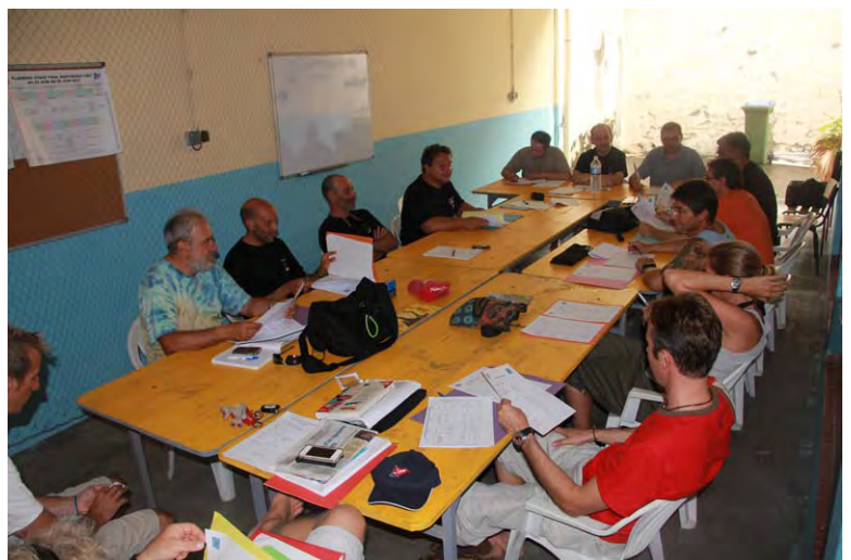
Accueil des stagiaires P4/GP